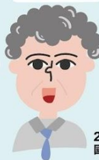
2020布里斯本 國際藝術節執行長