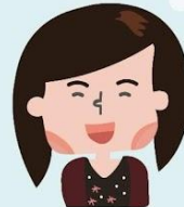
處理協會 相關事宜