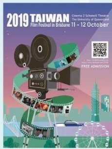
2019布里斯本電影節海報