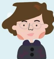
永久榮譽會長 主要創始人