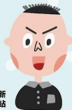
負責更新 協會網站