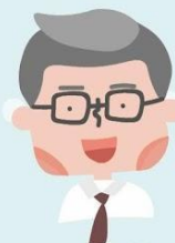
負責主導 協會活動